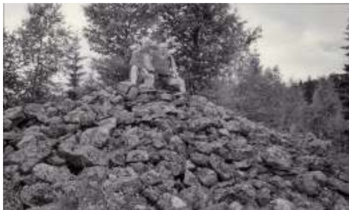
Gravrøys på Røverkulåsen.