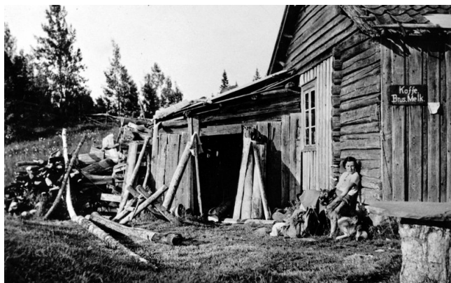
Lindeberget den gang det var servering