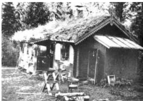
Svartvannshytta ca. 1940. Fra boken av H. Utter om Ø. Guderud. «Gutten som lurte Gestapo»

Turen er på ca. 9 km og går på god sti og litt på grusvei. Ta med godt fottøy, niste og noe å grille.