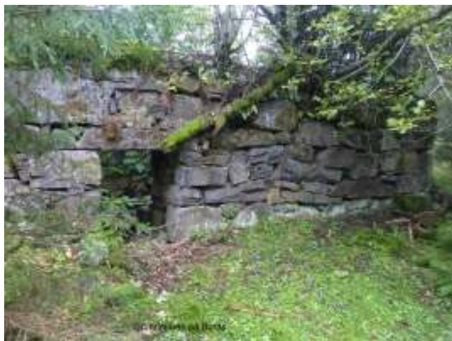
Grunnmuren på Burås.

Etter ca. en kilometer kommer vi til Mikkelsbånn som, navnet viser, var en kølamile. Stedet er et meget populært knutepunkt for turgåere hele året, med høysesong på vinteren. Lions club Bærum Vest har bygget opp flere buer i forskjellige eldre lafte- og byggeteknikker og holder åpent for servering i utfartshelger.