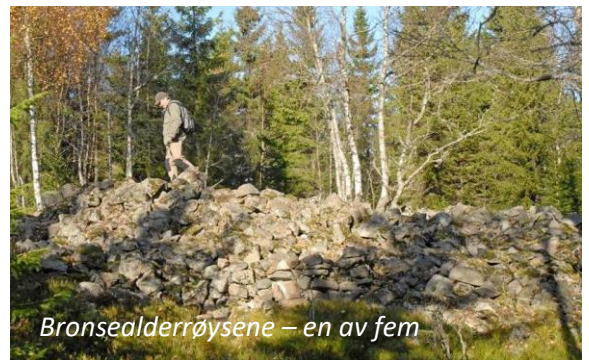
Bronsealderrøysene – en av fem

Turen går opp til de fem bronsealderrøysene (1800-550 f.Kr.), med en flott utsikt over Jaren og Tanum. Herfra hadde de gravlagte høvdinger utsikt over sitt «rike»? Hvordan de er bygget og hvor all steinen kommer fra, er fortsatt et mysterium. Nordover kommer vi ned på Svartvannsveien og tar av blåsti mot Økrisetra over Risfjellet . Derfra ned til Solstad og Jammerdalen med to husmannsplasser, søndre plass under Skui og den nordre under Bjørum. Vi går nedover forbi Sølvhølen , Bærums eneste canyon, Skuis svar på Aurlandsdalen. Deretter krysses Isielva mot Bjørum og forbi IL Jutuls gamle klubbhus , en ombygd tyskerbrakke fra krigens dager. Rett syd for denne lå hoppbakken Breskebakken . Det var lysløype i den løvskogkledde skråningen mot Isielva. Vi krysser igjen Isielven og turen avsluttes i Skuibakken.