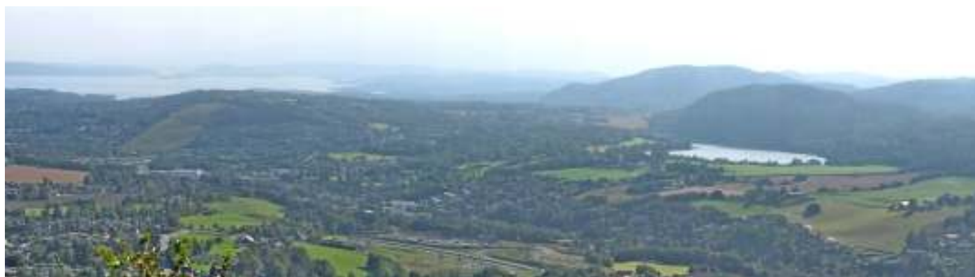
Utsikt over Vestre Bærum fra Solfjellstua mot Drøbaksundet, Kirkerud, Tanumplatået, Stovivannet, Ringiåsen, Skui mv

Turen arrangeres av Skuibakkens Venner i samarbeid med Skui vel og går både langs gårdsvei og på brede og smale stier i et flott kulturlandskap, gjennom skog og over åser med mange flotte utsiktspunkter.